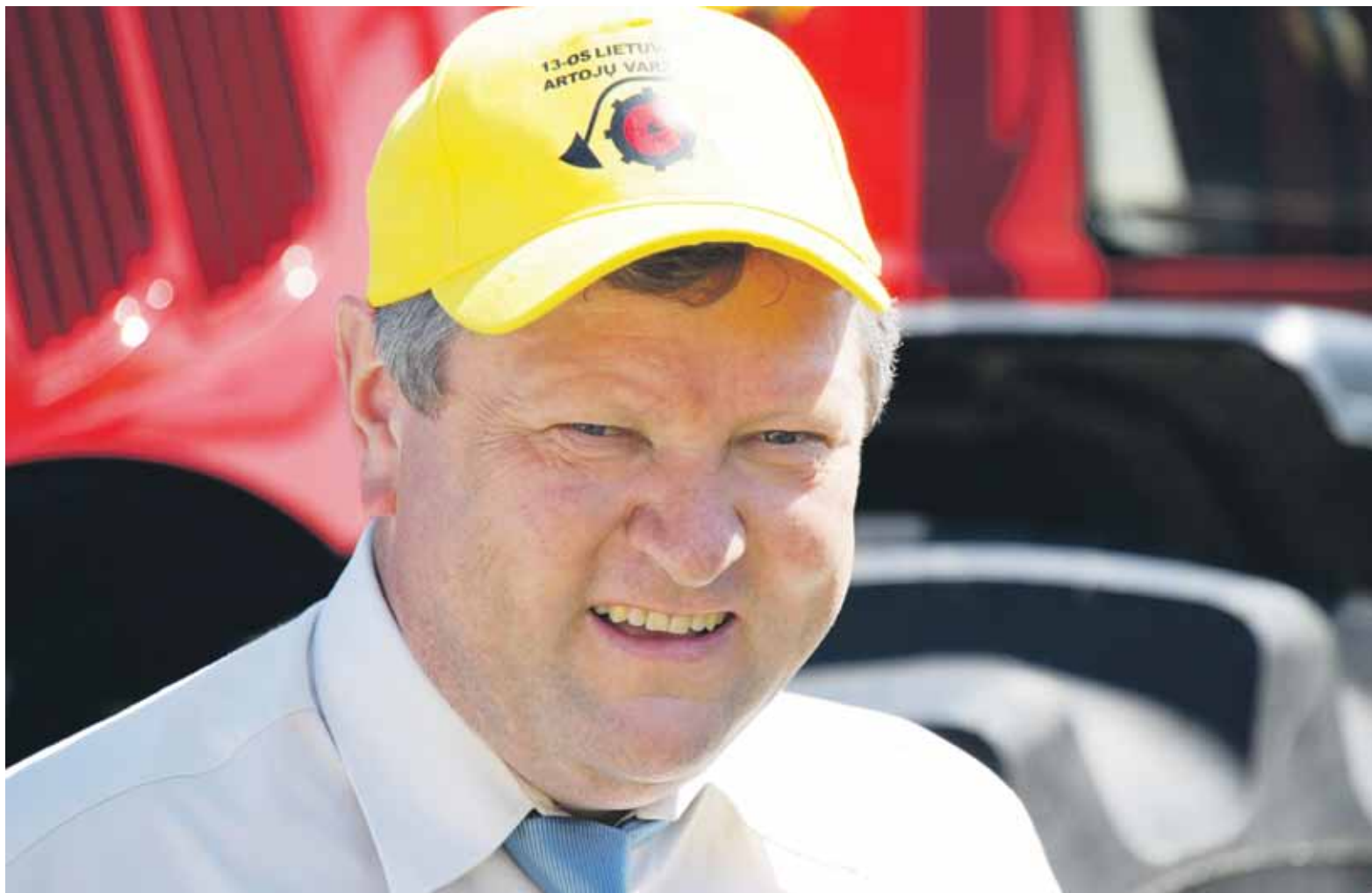
Žemės ūkio ministras Kazys Starkevičius: „Tikimės, kad ateinantys metai Lietuvos žemės ūkiui bus geresni, arba bent jau ne blogesni negu šie“. »6 PSL.