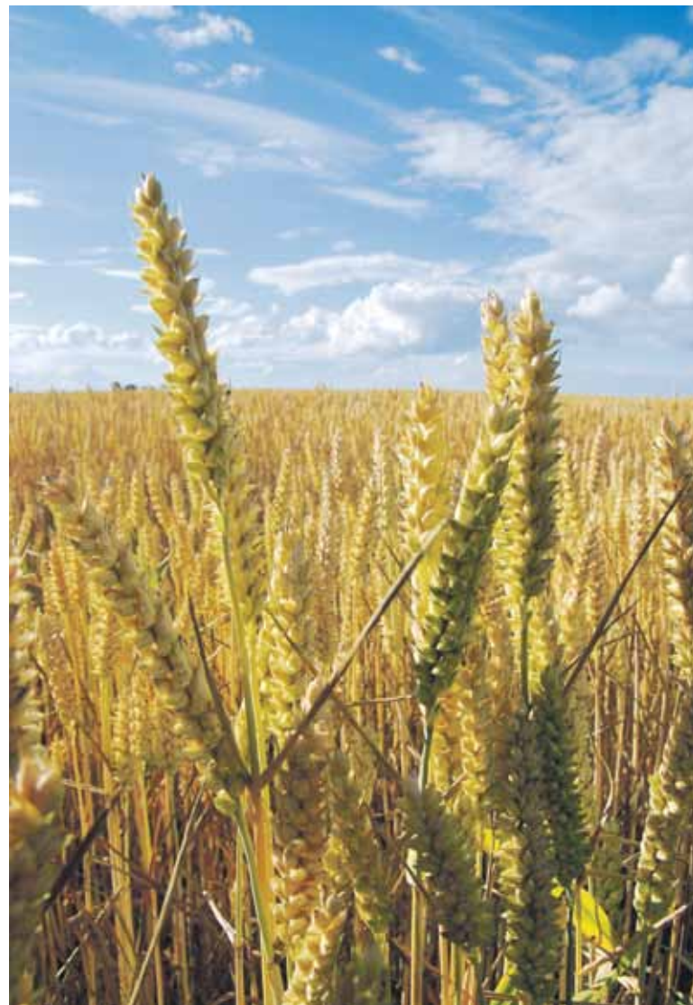
Tikslus paramos dydis kiekvienam ekologiškai ūkininkaujantiems žemdirbiui yra apskaičiuojamas individualiai ir priklauso nuo auginamų žemės ūkio kultūrų.

Parama ekologiškai ūkininkaujantiems žemdirbiams gali būti teikiama tik už sertifikuotą ir deklaruotą žemės ūkio naudmenų plotą. Todėl visi ekologinių ūkių savininkai turi būti įregistruoti ir turėti ekologinio žemės ūkio sertifikavimo įstaigos „Ekoagros“ išduotą sertifikatą.