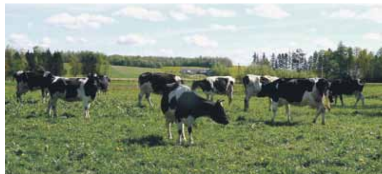
Labiausiai sumažėjo ūkių, turinčių 2–5 ha naudojamų žemės ūkio naudmenų.

1 PSL. Visus septynerius metus nuo 2003 m. visuotinio žemės ūkio surašymo stebimas ūkių stambėjimas. Šią tendenciją patvirtina ir pirmieji 2010 m. surašymo rezultatai. Vidutinis ūkio dydis (pagal žemės ūkio naudmenų plotą) padidėjo nuo 9,3 hektarų 2003 m. iki 13,8 hektarų 2010 m. Didelių, turinčių daugiau kaip 100 hektarų žemės ūkio naudmenų, ūkių buvo 3,8 tūkst. Jie sudarė 2 proc. visų ūkių ir valdė 42 proc. naudojamų žemės ūkio naudmenų. 2003 m. tokių ūkių buvo dvigubai mažiau.