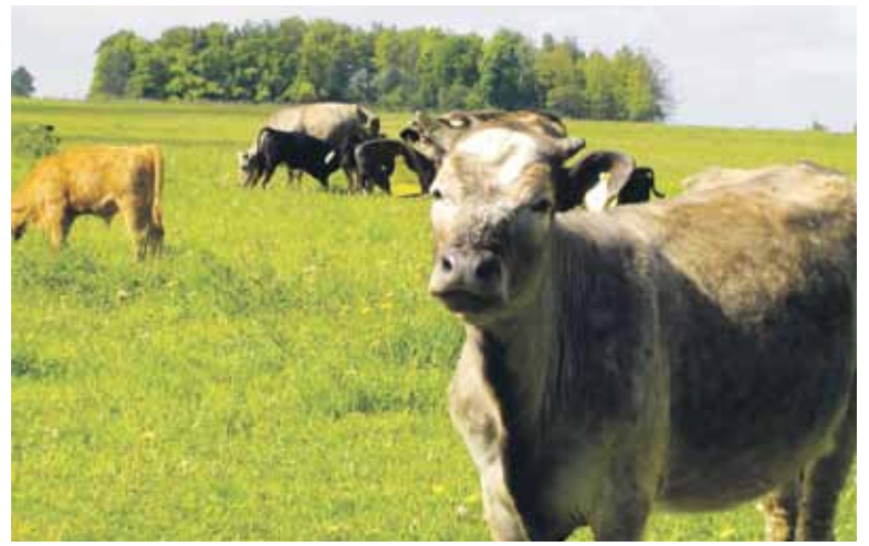
Trečia naujų reikalavimų grupė susijusi su ūkinių gyvūnų sveikatingumu.

Ūkinių gyvūnų laikytojas privalo nedelsdamas pranešti teritorinei valstybinei maisto ir veterinarijos tarnybai apie snukio ir nagų ligos, kiaulių vezikulinės ligos, mėlynojo liežuvio ligos, galvijų maro, smulkiųjų atrajotojų maro epizootinės hemoraginės elnių ligos, avių ir ožkų raupų, vezikulinostomatito, Tešeno ligos, žvynelinės ligos bei Rifto slėnio karštligės pasireiškimą.