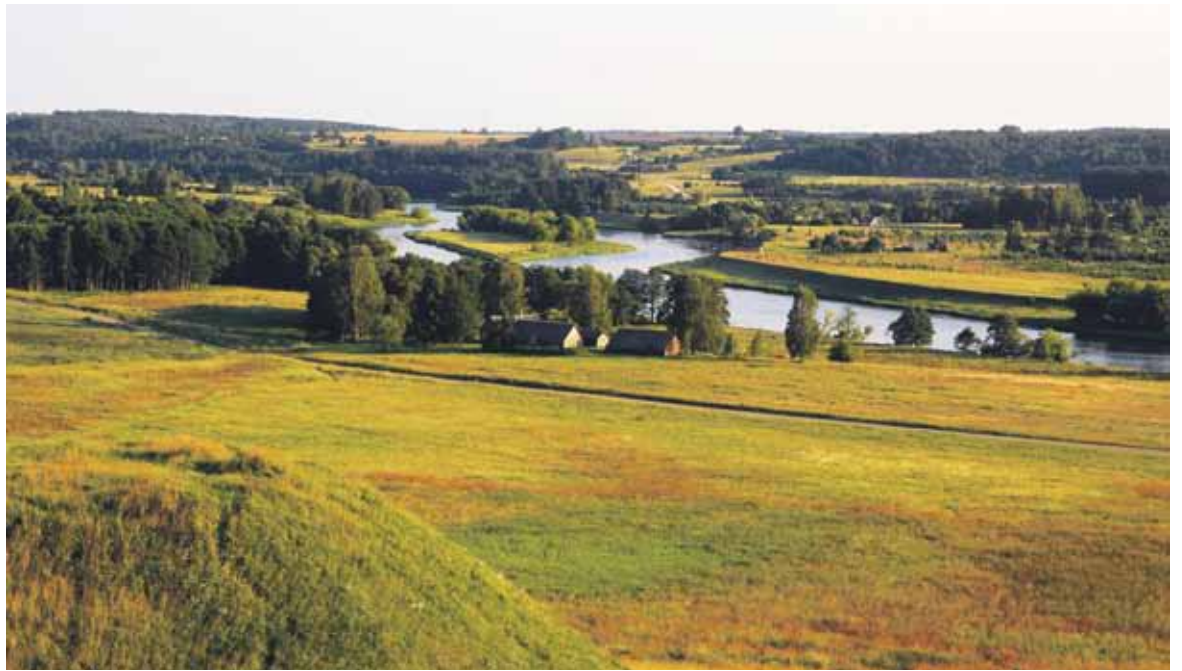
Dėl ekologinio ūkininkavimo pagražėja kaimų kraštovaizdžiai, ekologinės gamybos ūkiai natūraliai įsilieja į Lietuvos kraštovaizdį.

Lietuva, kaip maža šalis, neturinti žymių geografinių ar klimatinėlių sąlygų išskirtinumo, iki 2009 metų neturėjo ir gaminių, kuriems būtų pripažintas išskirtinumas. Tačiau 2010 m. sausio mėn. lietuviškas mėsos gaminyje „Skilandis“ įregistruotas į ES tradicinių gaminių registrą. Tai pirmasis produktas ne tik Lietuvoje, bet ir visose Baltijos šalyse, kurio tradiciškumas pripažintas ES lygiu ir suteikta teisė naudoti europietišku ženklu su nuoroda „Garantuotas tradicinis gaminyje“, patvirtinančiu savitą gaminių receptūrą bei išskirtinę kokybę. Tokių produktų gamintojai gali dalyvauti projektuose ir gauti paramą šių produktų propagavimui ir vartojimo skatinimui visoje ES ir trečiojoje šalyje. Šiuo metu nacionaliniu lygiu yra nagrinėjamos 2 paraiškos dėl saugomų geografinių nuorodų