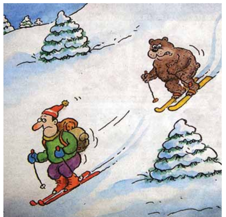
PAULIAUS LIDERMANO PIEŠ.

Būna atsitikimų, kad ar staugios ligos ar šiaip nelaimės pareikalauja iš ūkininko visų santaupų, bet tai tik išimtis. Tokį ūkininką ir tarnai supranta: iš jo nereikalauja taip greit atsilyginti. Bet jau tikrai blogos valios tas, kuris, atidėliodamas išmokėjimą už darbą, mano mokėjimo visai išvengti. Kas priklauso vis tiek