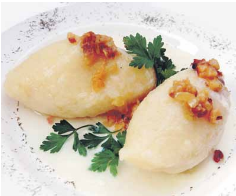
Ne tik didžkukuliai yra lietuvių nacionalinis patiekalas.

Gaminant padažą, grietinę ir sviestą kaitinti nuolat maišant, kol susidarys vientisa masė.