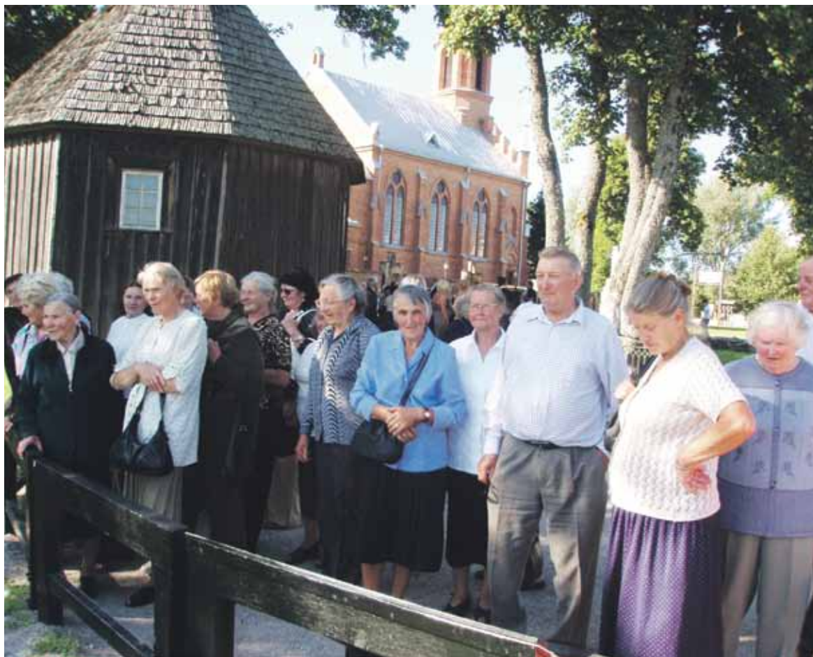
Senjorams patiko kelionės po gražiausias Lietuvos vietas.