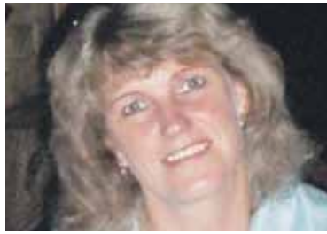
Lina ZELVOS SENIŪNIJA.

Pateikiame Ukmergės rajono gyven- tojų nuomones apie gyvenimą kaime.