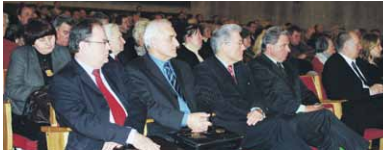
Į Šeimos ūkininkų suvažiavimą, vykusį Žemės ūkio rūmuose Kaune, buvo susirinkę šios sąjungos atstovai iš visų Lietuvos regionų.