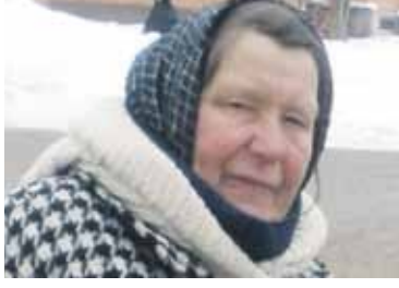
Stasė VEPRIŲ SENIŪNIJA.

Kalbino ir fotografavo Jolita ŽURAUSKIENĖ