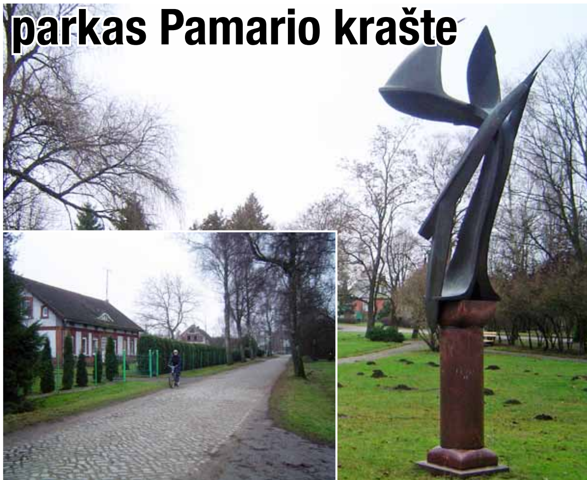
Juknaičių gyvenvietės – parko vaizdai vėlyvą rudenį.