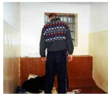
Šilutės policijos areštinėje nėra didelių patogumų. Tačiau nuteistieji dėl to nesiskundžia, nes yra gerai maitinami ir niekas jų neverčia dirbti.

«1 PSL. Šiomet per tokį patį laikotarpį – jau 4132. Pernai per visus metus areštuotųjų maitinimui buvo skirta beveik 1,82 mln. litų, o per šiuo metų 9 mėnesius policijos komisariatų areštinėse jau buvo pravalgyta daugiau kaip 1,68 mln. Lt. Kitąmet nuteistųjų administraciniu areštu maitinimas valstybei gali atsieiti ne mažiau kaip 1,96 mln. litų (maždaug tiek pinigų tam numatyta kitų metų Lietuvos policijos biudžeto projekte).