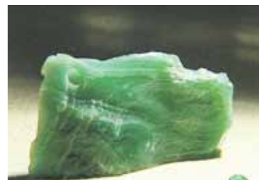
Juvelyrų teigia, kad tai itin brangus akmuo, labai tinkantis papuošalų gamybai (spręskite, pažiūrėję į nuotrauką).

Rašinio pabaigoje – dvi nedidelės, tačiau svarbios detalės.