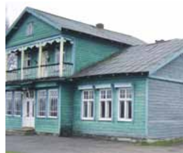
Šylių kaimo bendruomenės „Švyls“ namai įkurti buvusios medinės kaimo mokyklos mūriniame priestate.

Anksčiau Šyliai garsėjo savo degtindariais. Šiuo metu, A. Biurkland ir į susitikimą su „Šaltinio“ žurnalistu atėjusių bendruomenės moterų teigimu, šis nelegalus verslas jų kaime baigia išnykti. Užtat dabar šyliškiai didžiuojasi savo kaime turėdami