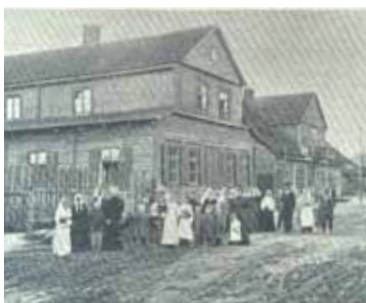
Panevėžio Labdariškosios Draugijos prieglauda.

iš Didžiojo altoriaus ir atmušta skarbonka. Sargas sergėjo bažnyčią, bet išryto kai jis nuvėjo namon, tai vagis užlipęs ant vargonų ir išleidęs per langą virvę, atrištą nuo varpo, virve nusileido žemyn. Piktadario ligišiol nesugauta.