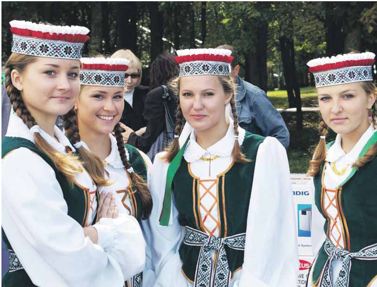
Iš kuklaus kitų planuojamo biudžeto trupiniai teliks tradicinei lietuvių kultūrai puoselėti.