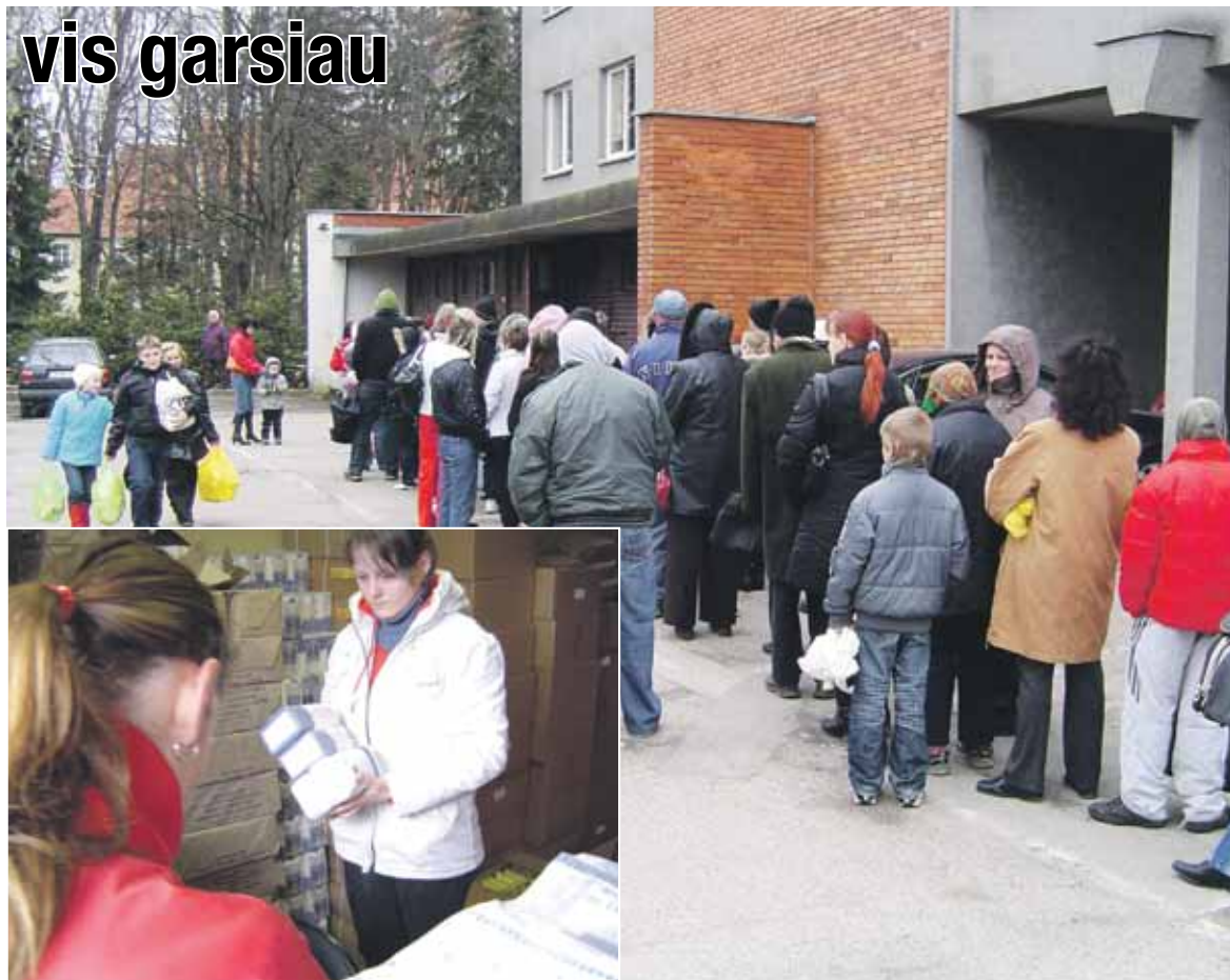
Vien tik Šilutės mieste į eilę nemokamo maisto kas antrą mėnesį rikiuojasi daugiau kaip 2000 gyventojų – apie 10 proc. visų šilutiškių. Rajono vidurkis 2 kartus didesnis – beveik 19 proc.

LR Žemės ūkio ministerija jau suskaičiavo (paskutiniai prašymai paramai maistu gauti šiais metais buvo priimami iki spalio vidurio), kad skurstančių lietuvių pamaitinimas šiemet atsieis šiek tiek mažiau, nei EK skyrė pinigų – apie 30,7 mln. litų.