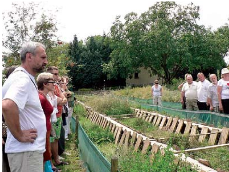
Trakų krašto kultūros ir amatų asociacijos nariai apžiūrėjo sraigių ūkius ir ganyklas