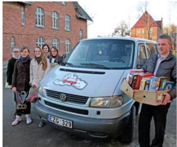
Svarbiausia – komandinis darbas

2012 m. VVG „Nemunas“ yra pateikusi projektinį pasiūlymą „Jurbarko rajono jaunimo verslo nišų analizė“, ketina atlikti studiją apie rajono jaunimo verslo galimybes, rengia projektinius verslo idėjų pasiūlymus.