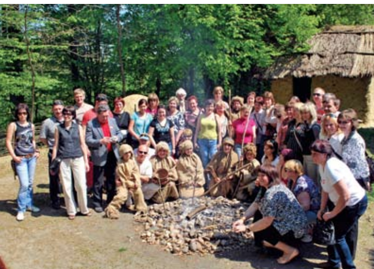
Tinklo projekto vykdymas yra galimybė išeiti už savo kiemo vartelių, už savo kaimo ribų. Viešnagė Slovėnijoje