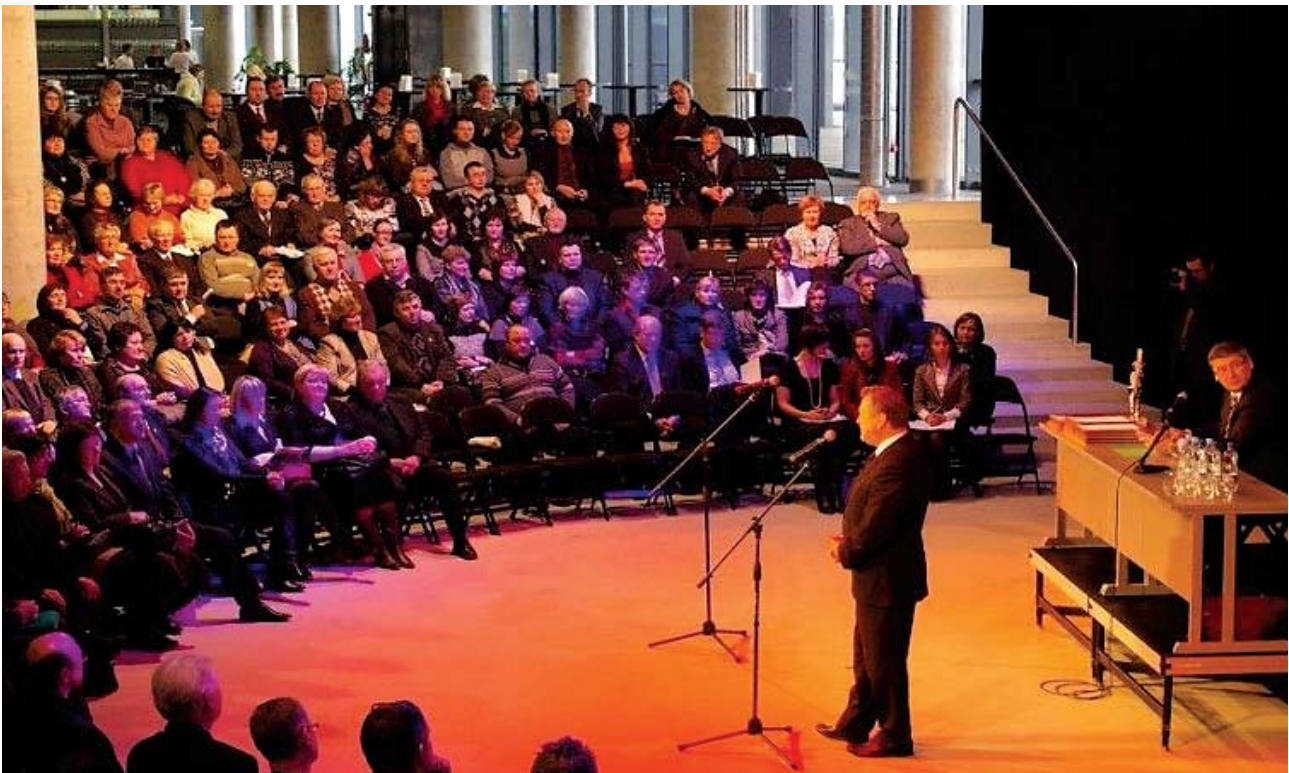
Žemės ūkio ministras Kazys Starkevičius dėkojo Tinklo nariams už pasiektus gerus rezultatus

Trečioji vieta skirta Pagirių kaimo bendruomenės centro projektui „Kauno rajono bendruomeninių organizacijų jaunimo praktinė konferencija“. Už projektą balsavo 68 asmenys. Pasak šios bendruomenės centro atstovų, sukviestam Kauno rajono bendruomeninių organizacijų jaunimui dviejų dienų praktinėje konferencijoje pateikti paprasti ir lengvai įgyvendinami patarimai, kaip sveikiau maitintis. Konferencijos metu organizuotas ir konkursas „Sveikas maistas – ekologiški produktai“.