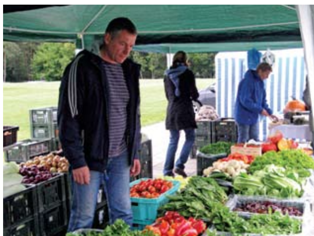
Ekologinio ūkininkavimo modeliu visai Lietuvai tapusi „Tatulos programa“ į savo muges Vilniuje ir kituose miestuose kviečia jau 17 metų