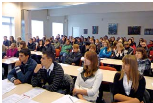
Baigiamoji projekto konferencija