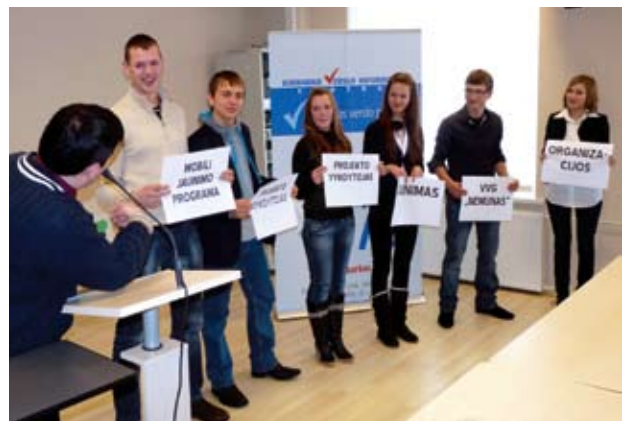
Projekto dalyviai pristato idėjas