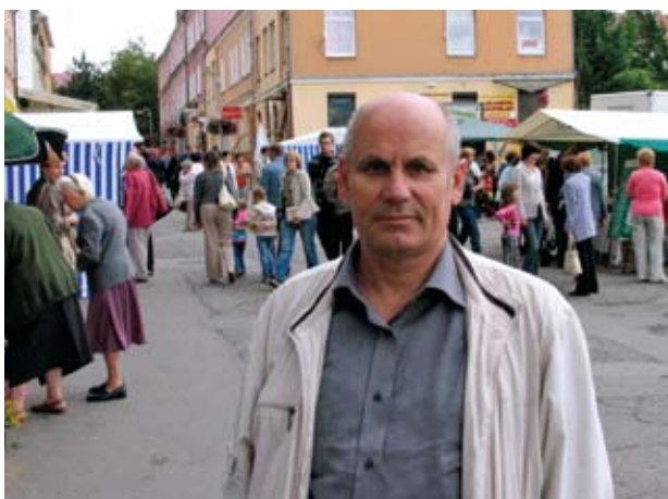
2012 m. „Tatulos programa“, vadovaujama Almono Gutkausko, pateikė paramos paraišką veiklai tęsti pagal Programos priemonės „Techninė pagalba“ veiklos sritį „Nacionalinis kaimo tinklas“